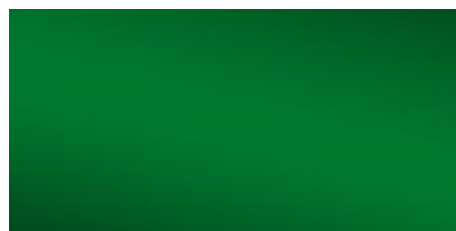
JW/KK94 140 µm